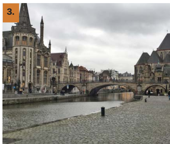
1. Case Fiamminghe delle Corporazioni 2. Belfort 3. Canale del fiume Leie

FORMARSI PER CELEBRARE PASTORALE LITURGICA PARROCCHIALE